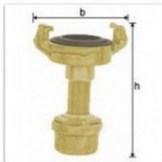
Regulowana dysza ze złączem kłowym z odcięciem przepływu