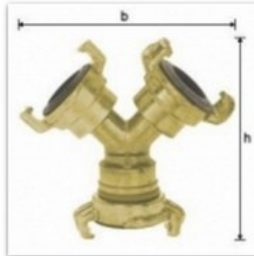
Trójnik do wody ze złączami