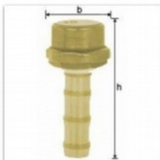
Regulowana dysza z odcięciem przepływu