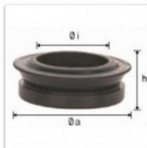
Uszczelka gumowa (NBR)