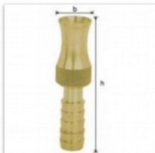
Regulowana dysza bez odcięcia przepływu